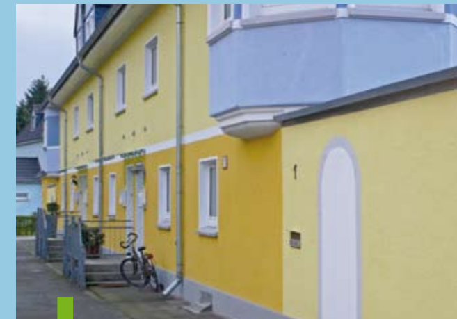
an der höhe

Geplant ist die Fertigstellung der gesamten Baumaßnahme „Am Borgschenhof 24-34“ für Anfang Juni 2008.