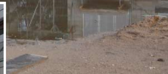
anlieferung und einbau von vorgefertigten mauerwerksteilen an der baustelle