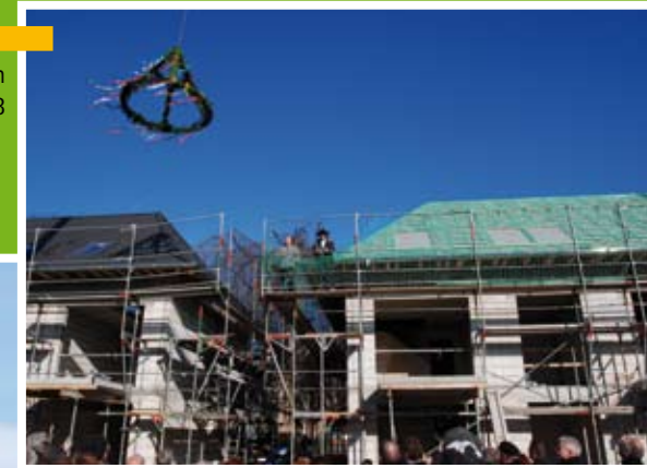
richtfest am 15. februar 2008