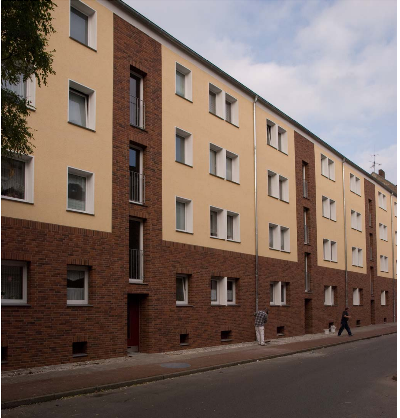
Straßenansicht kurz vor Fertigstellung